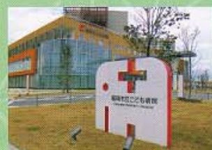
写真は過去の入賞作品です。